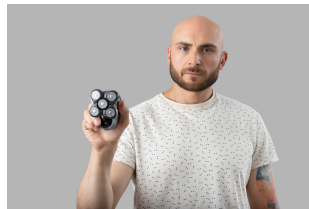
Fertiger Look + Produkt