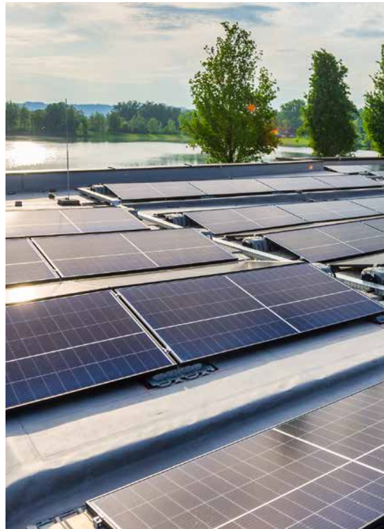
Feldkirchen | AT

Die voestalpine Automotive Components Schwäbisch Gmünd GmbH & Co. KG steht seit Jahrzehnten für Qualität und Service in der Umformtechnik. Als Zulieferer in der Automobilindustrie haben wir eine hohe technische Innovationskraft entwickelt, die wir heute auch in die Solarindustrie investieren. Wir entwickeln Systemlösungen für die Photovoltaik (PV) mit einer Bandbreite an Produkten, die perfekt aufeinander abgestimmt sind, nahtlos ineinandergreifen und an unterschiedliche Anforderungen anpassbar sind. Seit 2012 steht genau dafür die patentierte Systemlösung iFIX.