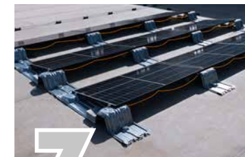
3 PV-MODUL MONTIEREN