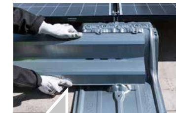
4 DEFLECTOR EINSCHIEBEN

Vorgehensweise immer der aktuellen Montageanleitung entnehmen.