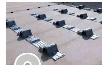
2 MIT BALLAST BESCHWEREN