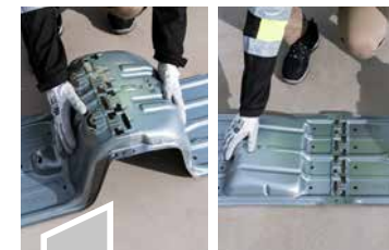
1 iFIX MIT WENIGEN CLICKS VERLEGEN